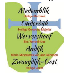
Parochies Regio Wervershoof

Helaas is de geplande parochiedag van 22 januari 2022 voor de parochies van onze regio niet doorgegaan. In plaats daarvan hebben we als parochiebestuur een video-boodschap opgenomen waarin uiteen wordt gezet welke weg we in willen slaan, Samen met het stuk "Nieuwe Adem" is de video-boodschap op 3 februari 2022 naar de parochieraden van de regio verstuurd. De opdracht daarbij is om dit ter sprake te brengen binnen de parochieraad en tevens met de betrokken parochianen, bijvoorbeeld de parochianen die ook naar de parochiedag wilden komen. Voor 15 maart 2022 hoop ik de eerste reacties te hebben ontvangen van de parochies, zodat we daar als parochiebestuur verder mee kunnen. Tot zover het laatste regionieus.