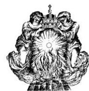
DE VEREERING VAN HET H. MIRAKEL VAN AMSTERDAM

"Levend brood voor onderweg, in stille getuigen."